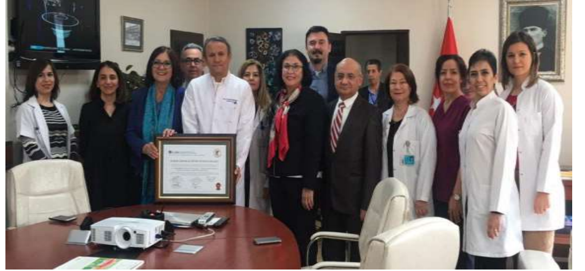
Sağlık Bilimleri Üniversitesi İzmir Tepecik Eğitim ve Araştırma Hastanesi İnfeksiyon Hastalıkları ve Klinik Mikrobiyoloji Kliniği (15 Şubat 2019)