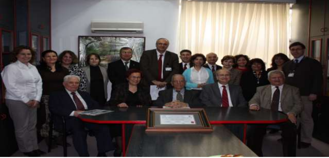
Uludağ Üniversitesi Tıp Fakültesi İnfeksiyon Hastalıkları ve Klinik Mikrobiyoloji AD (12 Kasım 2010)