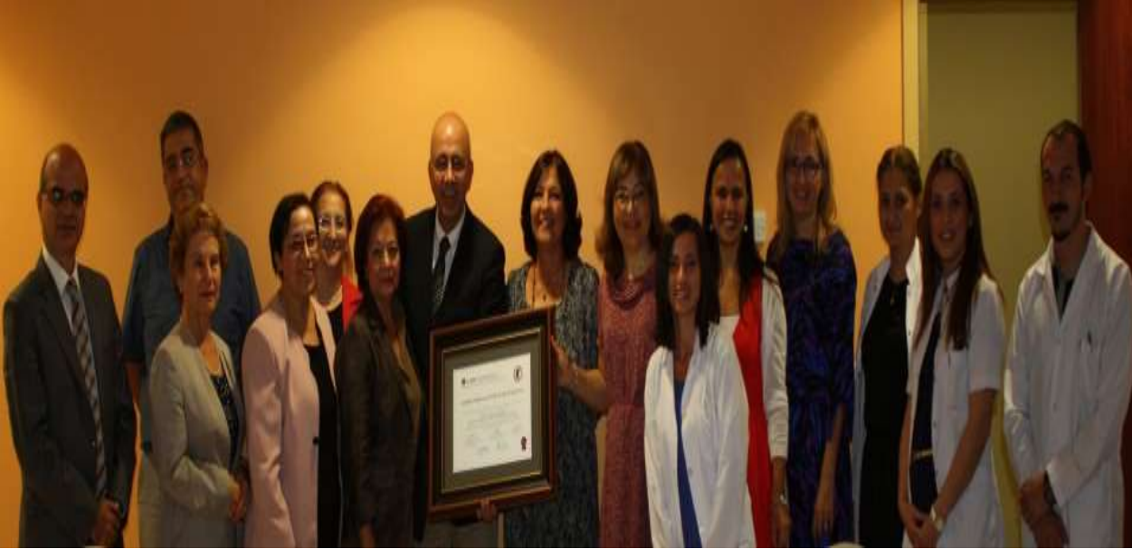
Kocaeli Üniversitesi Tıp Fakültesi İnfeksiyon Hastalıkları ve Klinik Mikrobiyoloji AD (20 Eylül 2013)