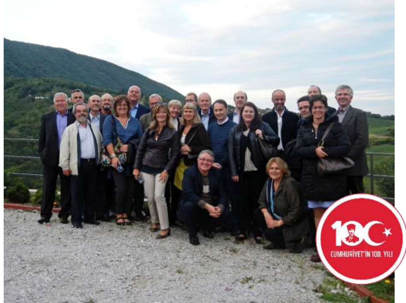
Yıllık UEMS İnfeksiyon Hastalıkları Seksiyonu Toplantısı (Zagreb, 21 Eylül 2013)