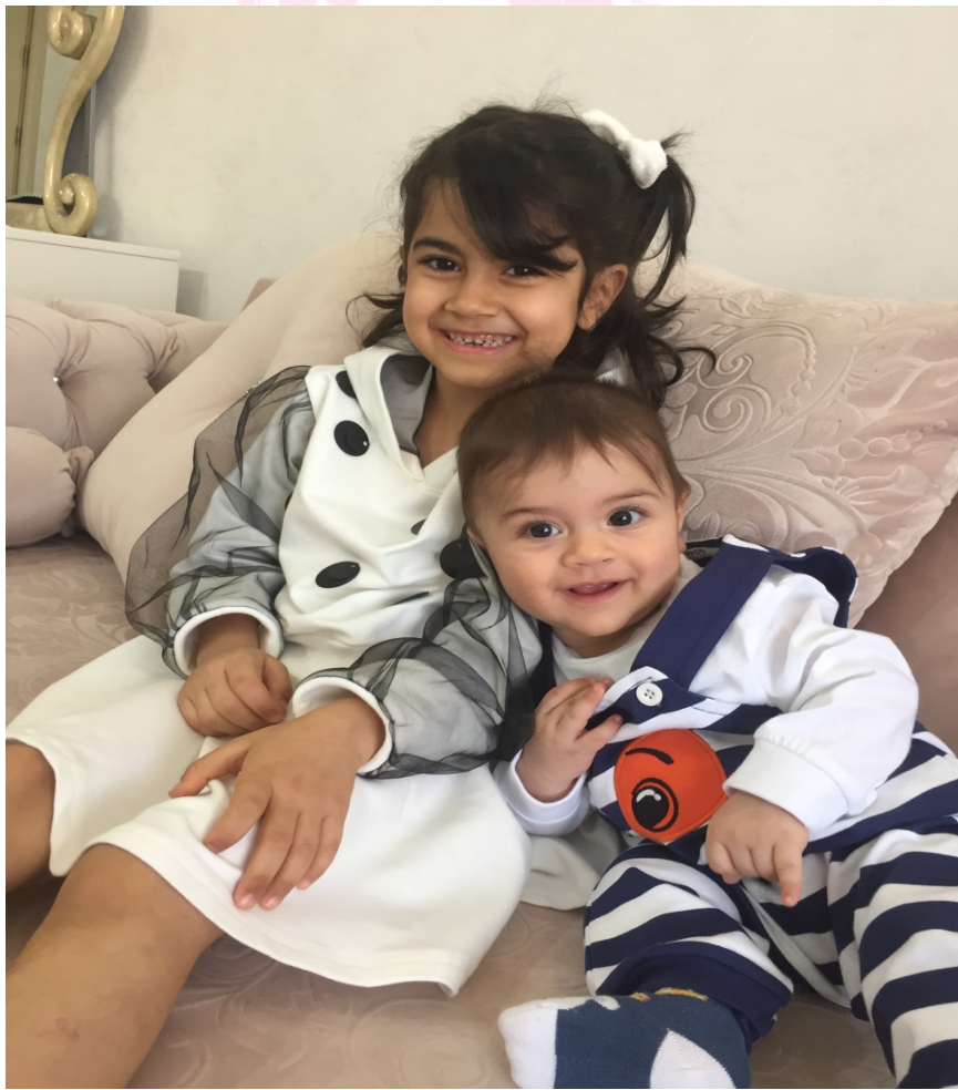
3 Haziran 2023, İSTANBUL