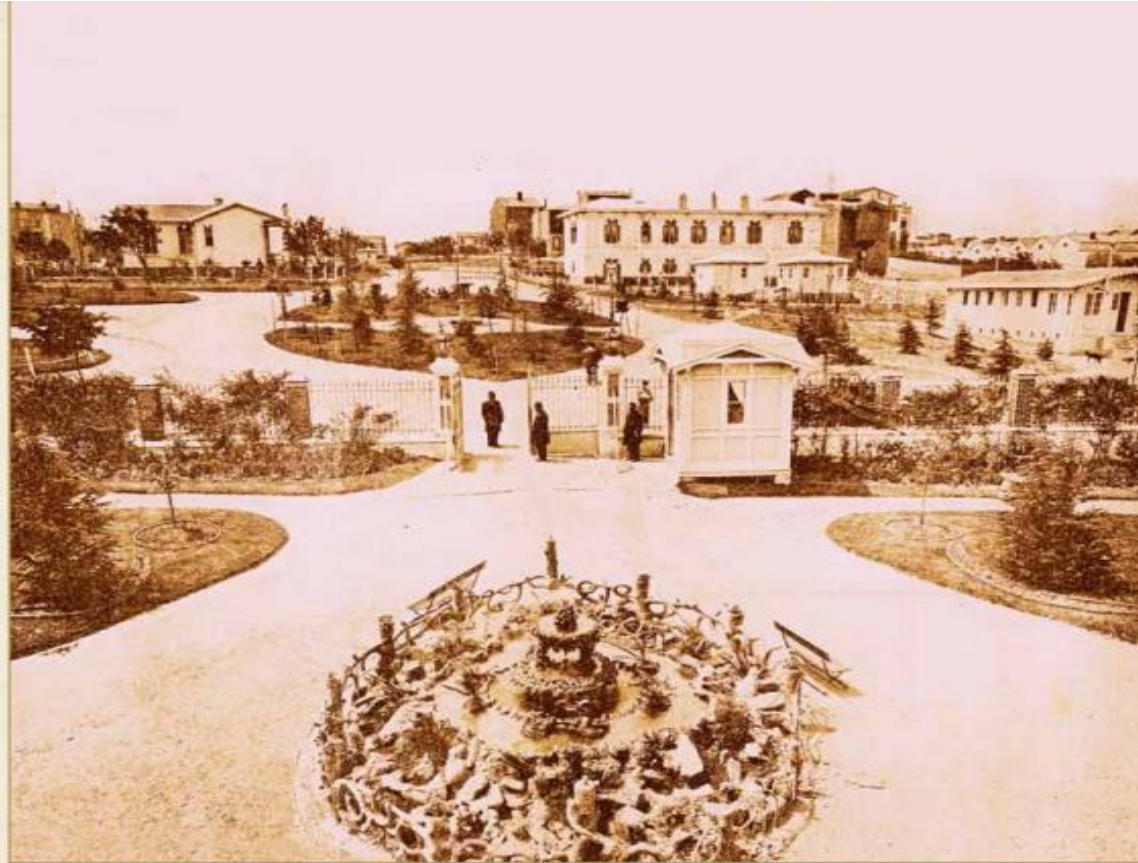
Hastanenin genel görünümü (İstisatîk 1904, 12)